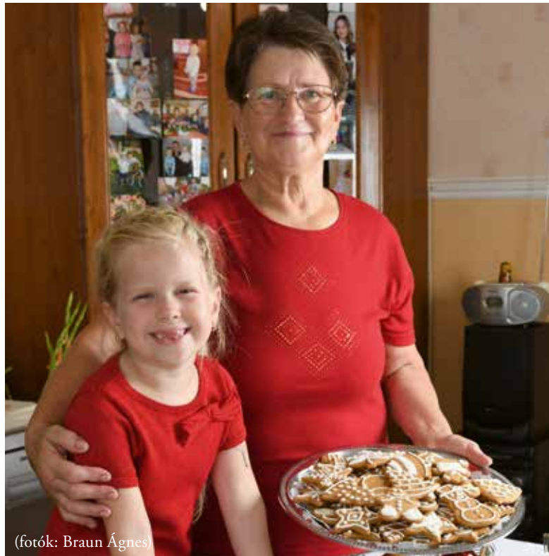
(fotók: Braun Ágnes)

(forrás: 100 Dabasi recept, több mint 100 dabasi háziasszony)