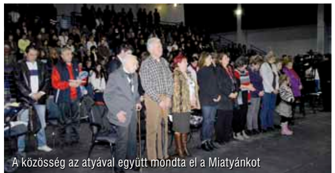
A közösség az atyával együtt mondta el a Miatyánkot