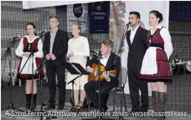
A Szent Ferenc Alapítvány nevelőjének zenés-verses összeállítása