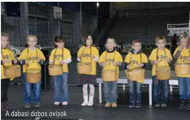
A dabasi dobos ovisok