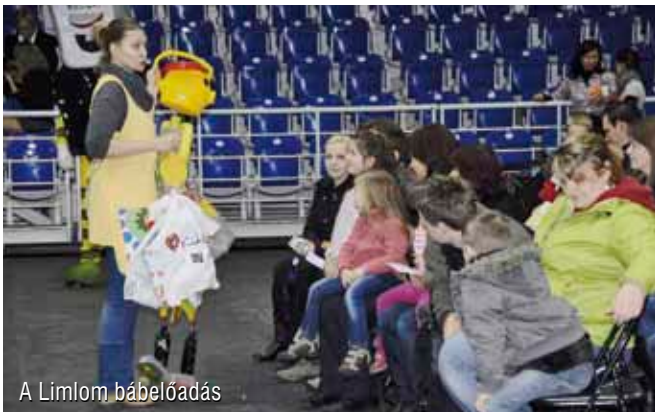
A Limlom bábelőadás