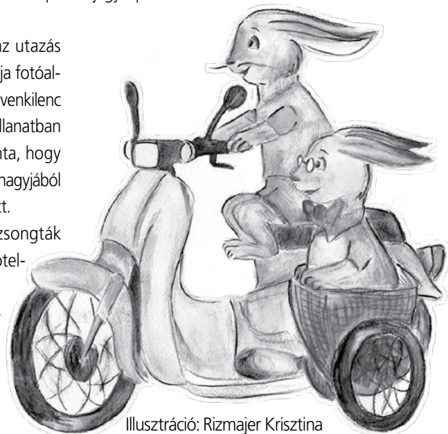
Illusztráció: Rizmajer Krisztina

Így aztán a nap hátralévő részében Nyúl Ubul a te kedvenc színdere festett motorjával le, s föl száguldozott az erdőben Imbi bácsival és a nyúlfiakkal, az erdő lakóinak nem kis ámulatára. S hogy meddig marad Nyúl Imbiba? Megsúgom, hogy a bőröndje mélyén a krémek és az ernyők alatt egy, az Afrikába tartó legutolsó gólyajáratra szóló jegy lapul.