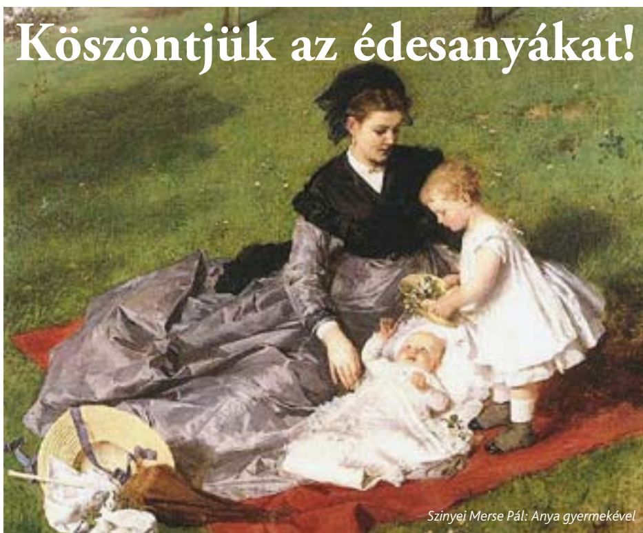
Szinyei Merse Pál: Anya gyermekével