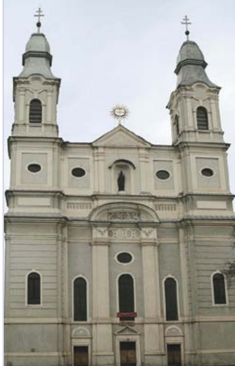
A csíksomlyói Mária templom

Egy árva dalt. Azt veregeti folyton, és megbicsaklik elefántcsont uja a fekete-fehér elefántcsonton. És elfelejti, próbálgatja egyre, és szállni vágy, mint vérző sas a hegyre, mert szállni tudna, szállni és röpködni, de visszahúzza újra ezer emlék. Ezt zongorázta kisleány-korában, s mikor apuskával egymást szerették. Ezt próbálgatta, amikor születtem, és megtanulta, elfeledte csendben. Jaj, mennyi vágy van benne, hosszú évek. Egy szürke dalban egy szent, szürke élet. Hogy össze nem rogy a szobánk alatta, hogy össze nem rogy menten, aki hallja. E dalban az ő ifjúsága halt el, s a semmiségbe hervadt vissza, mint ő. Kopog-kopog a rossz, vidéki valcer, és fáj és mély, mint egy Chopin-keringő.