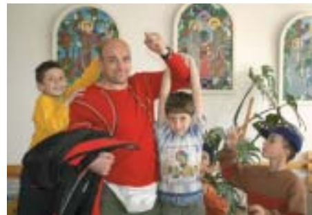
A dévai árvaház kis lakói szeretettel fogadták a küldöttséget