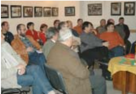
Vállalkozói fórum Baróton