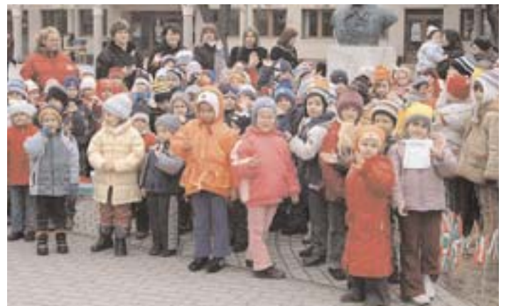
A dabasi és a sári óvodások megemlékezést tartottak a Kossuth-szobornál