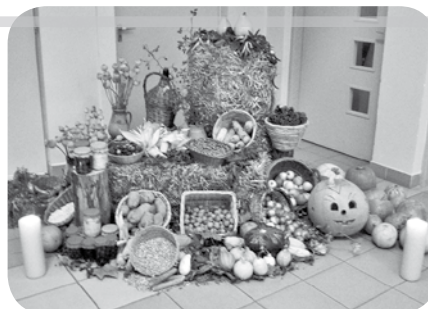
„Néztétek csak, mennyi mindent gyűjtöttünk az őszi folyamán!”