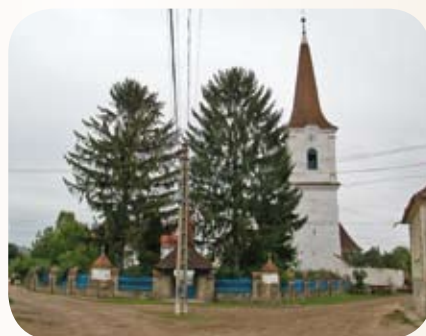
Az oklándi templom