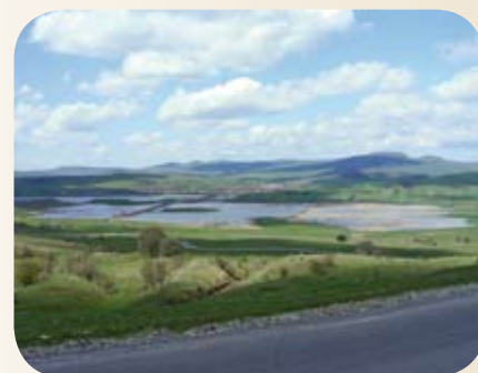
A szentpáli tavak