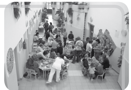
„De jó, hogy anyukám, apukám, nagymamám is itt van velem.”