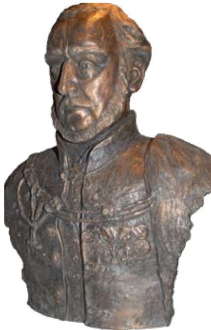
Gábor Emese alkotása

Az 1830-ban megjelent „Hitel” című munkájában a reformkor programját fogalmazta meg. A műben Széchenyi kifejtette, hogy hitel nélkül nincs korszerű gazdálkodás. Megfogalmazta a gyakorlati tennivaló-