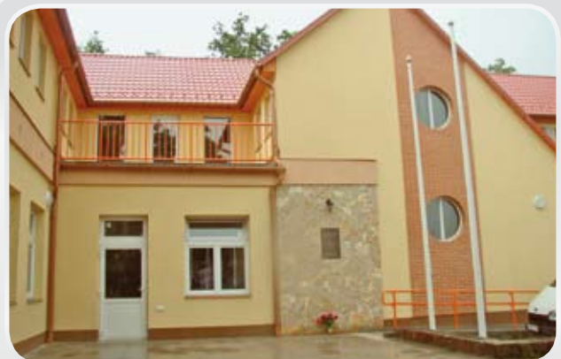
Révfülöp, Kacsajtos u. 50. sz.

TÁMOGASSA ADÓJÁNAK 1%-ÁVAL A RÉVFÜLÖPI ÜDÜLŐTÁBOR FELÚJÍTÁSÁT! AZ ALAPÍTVÁNY ADÓSZÁMA: 18664658-1-13