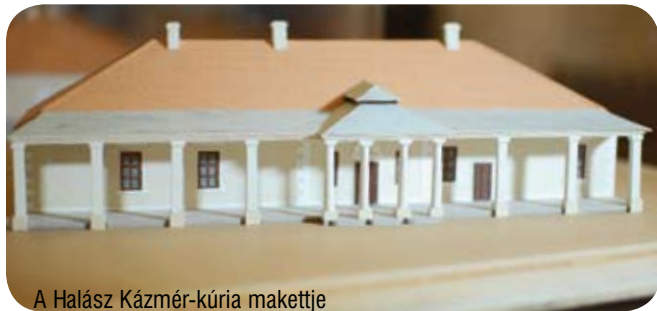
A Halász Kázmér-kúria makettje