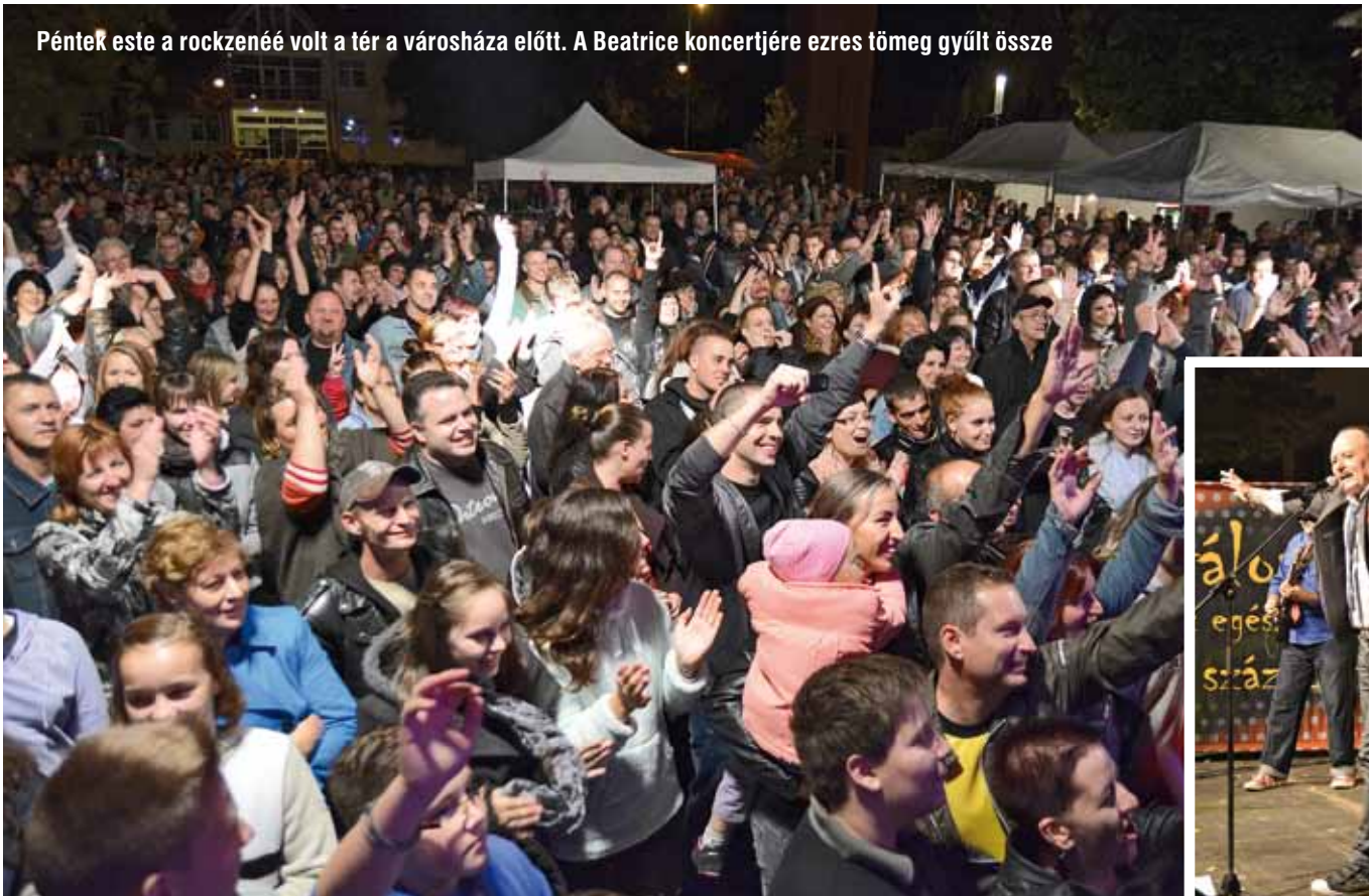
Péntek este a rockzenéé volt a tér a városháza előtt. A Beatrice koncertjére ezres tömeg gyűlt össze