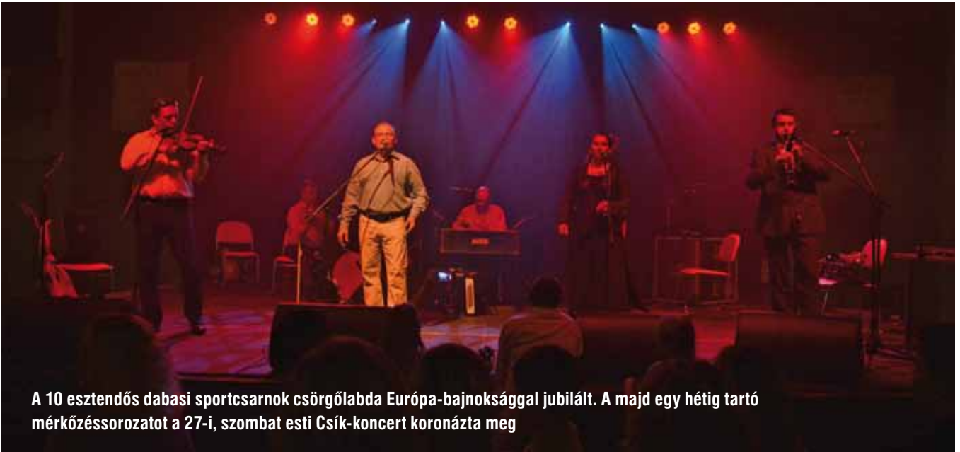
A 10 esztendőes dabasi sportcsarnok csörgőlabda Európa-bajnoksággal jubilált. A majd egy hétig tartó mérkőzésorozatot a 27-i, szombat esti Csík-koncert koronázta meg

Szeptember 28-án, vasárnap a dabasi állomáson a motorosok közössége és az érdeklődők fogadták a nosztalgiagőzöst a Budapest-Lajosmizse vasútvonal létrejöttének 125. évfordulója alkalmából.