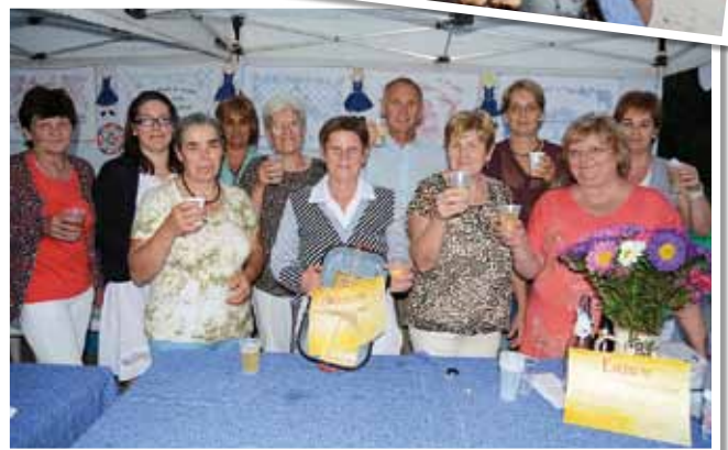
A Vándortepsi Díj nyertese a Dabasi Intézményfenntartó Központ csapata