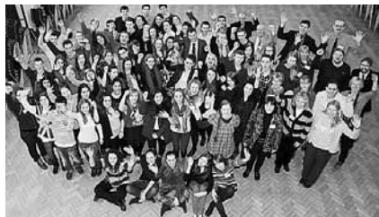
2014. január 17–22. West Kirby, Anglia