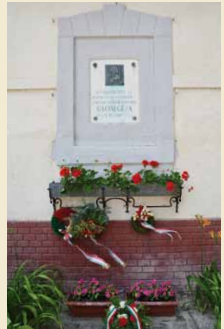
Fotók: Karlik Dóra