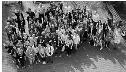
2014. április 02–07. Poznan, Lengyelország