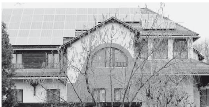
A DABASI ÁTRIMUM IDŐSEK OTTHONÁNAK ÉPÜLETE A FEJLESZTÉST KÖVETŐEN

A projekt az Európai Unió támogatásával valósul meg.