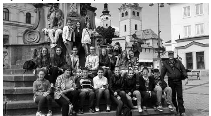
Szöveg és fotók: Rusnák Atila

A fellépés után szívesen maradtunk volna vendéglátóinkkal, de a hosszú út miatt el kellett indulnunk. Nagyon szépen köszönjük a segítséget mindazoknak, akik valamilyen módon hozzájárultak a nap eredményességéhez, lebonyolításához.