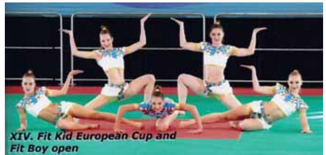
XIV. Fit Kid European Cup and Fit Boy open