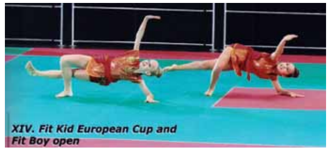
XIV. Fit Kid European Cup and Fit Boy open

A TOP Fitness SE sportolói ezúton szeretnék megköszönni a szponzoroknak, hogy segítettek az Európa-bajnokságon való részvételüket, hozzájárultak sikeres versenyzésükhöz. Támogatóink: