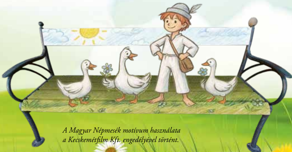
A Magyar Népmesék motívum használata a Kecskemétfilm Kft. engedélyével történt.