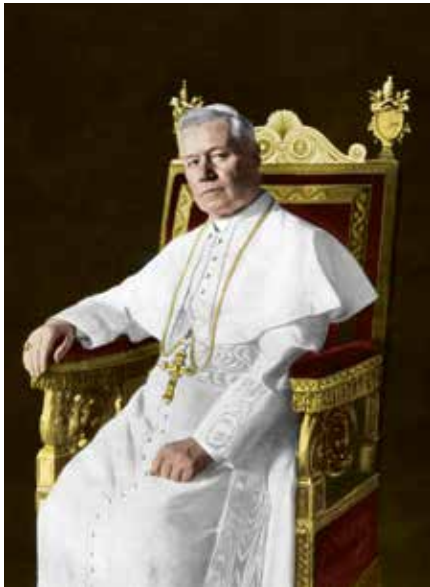
X. Piusz pápa

mesterektől meghívásokat és felkéréseket kapott hitszónoklatok és felolvasások tartására. A szerző beclése szerint: „összesen így ötvennégy hitszónoklatot, negyvennyolc felolvasást és kétszáz apróbb előadást és beszédet mondtam el.” A rendezvényeket általában napokkal korábban meghirdették az adott település lapjaiban, így biztosítva és felkészítve a megfelelő létszámú közönséget. A bevétel jellemzően karitatív célokat szolgált,