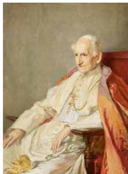
XIII. Leó pápa

Az interjúkat, cikkeket, rövidebb-hosszabb híradásokat a megjelenést követően, a napi rutin keretében következetesen kontrollálta, amelynek időigényét jól érzékelteti, hogy a sajtóközlések száma Ausztráliában ötszázra tehető, melyhez harmadannyi még Új-Zélandban is tár-