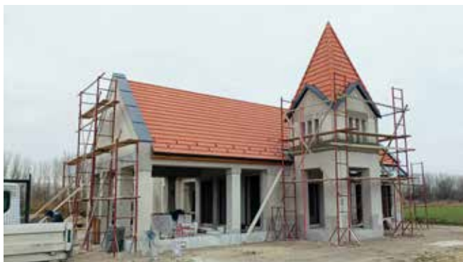
Jó ütemben halad az új Sári ravatalozó építése.

A Dabasért Közalapítvány a Bethlen Gábor Alap támogatásával elkezdte a város legrégebbi műemlék épülete, a gyóni Zlinszky-kúria teljes belső felújítását.