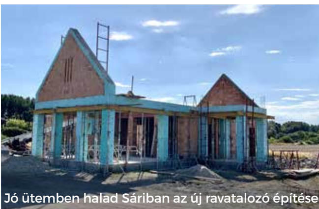
Jó ütemben halad Sárban az új ravatalozó építése

A Luther utca két ikonikus épülete is többek között önkormányzati támogatással újul meg. A Győni Tájház állagmegóvó felújítása, valamint az evangélikus parókia is felújítása is jó ütemben zajlik