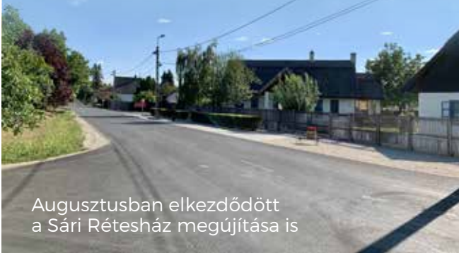
Augusztusban elkezdődött a Sári Rétesház megújítása is

A magyar kormány céltámogatásából megvalósult a Mánteleki út felújítása, amely az ott található intézményeken túl a Mánteleki ipari övezetben található vállalkozások megközelítését is szolgálja