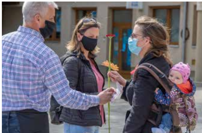
Fotók: Karlik Dóra

Ezért is tartottuk fontosnak, hogy egymástól kicsit ugyan távol, mégis egymás szívéhez közel adjunk hálát az édesanyákért, nagymamákért és a város nagy családjáért.