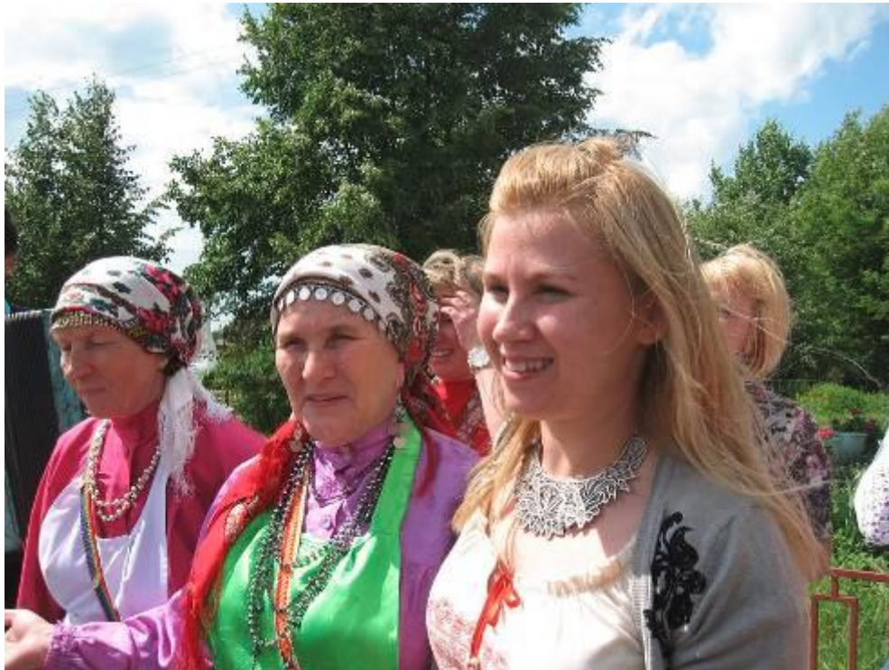
(A fiatal magyar tehetség a világ számos pontján hirdeti a magyar szót, a magyar zene, a magyar népzene lélekbehatoló szépségének erejét, s mindenhol örömmel fogadják. Udmurtföldön Posdival faluban az asszonyok énekszóval és virágokkal fogadták.)