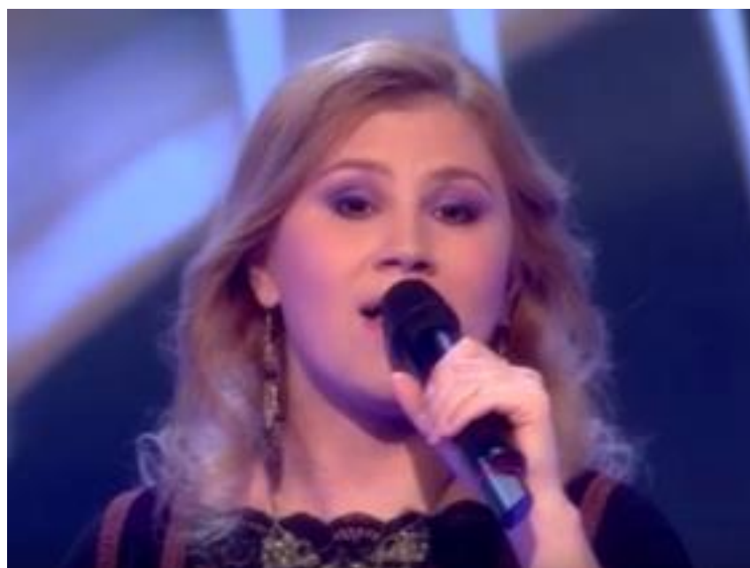
(2015-től saját operát ír az énekesnő, szerző: Nimród, Hunor, Magyar mondáján alapuló „Nimród regéje” című szimfonikus népi operát. A 13 dal kottája, szövege már papíron, most a stúdiómunka zajlik, s a rendkívüli, egyedülálló alkotás szponzori segítségre várva áll kiadás előtt.)