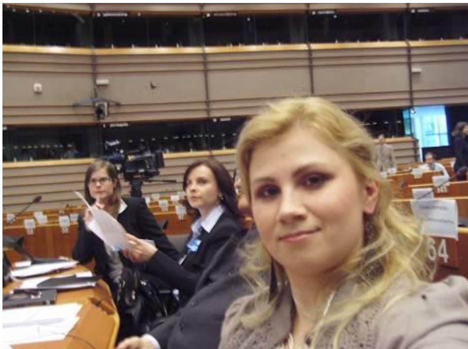
(2011-ben az EU Parlamentben a magyar küldöttség díszvacsoráján énekelt, s ekkor már Brüsszelben és az EU Parlamentben is körülnézhetett egy kicsit.)