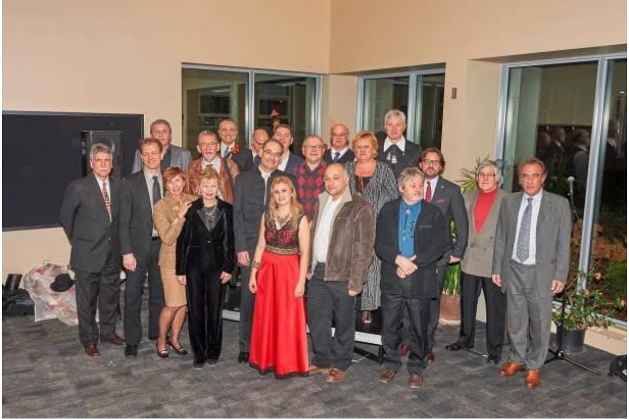
(Legutóbbi, 2015-ös Kanadai turnéján torontói szervezők és művészek gyűrijében.)