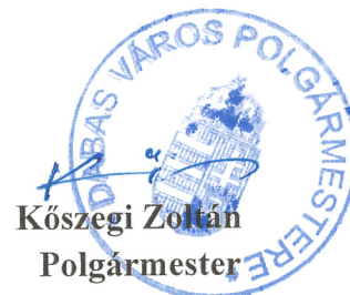
Kőszegi Zoltán Polgármester